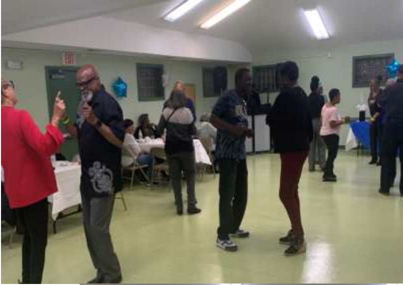
Algunas fotos con - GROWN FOLKS NIGHT OUT - Viernes, 15 de marzo de 2024 - Gracias Sylvia G.