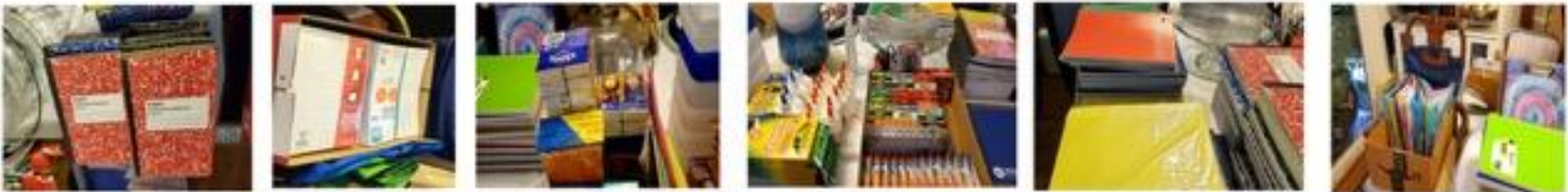
These pictures represent the assemble lines of supplies for each grade of primary education experiences.